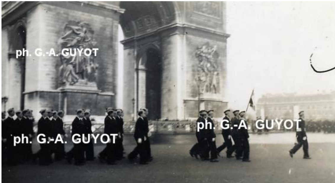
11 novembre 1940 : la corniche Louis-le-Grand (dont fait partie GA Guyot) défile sur les Champs.

Reçu à Saint-Cyr je crus à ceux qui affirmaient que la petite armée d'armistice serait le creuset de notre revanche. Hélas, comme je viens de le dire l'occupation de la zone libre en 1942 mettait fin à ce rêve.