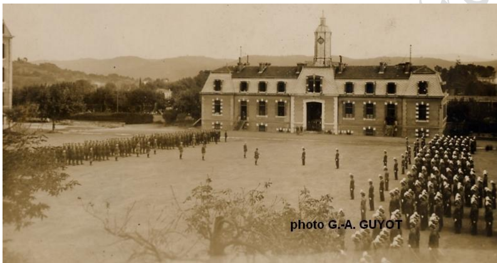
L'École Spéciale Militaire de Saint-Cyr repliée à Aix-en Provence (caserne Miollis) Ici, la promotion « Charles de Foucauld ».